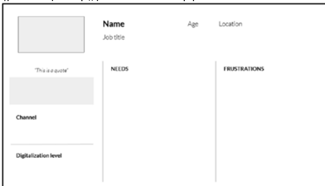
Рисунок 1: Учебный инструмент, разработанный компанией Latte Creative для семинаров проекта «Дело за тобой (Твоя очередь)! Учителя за обновление профсоюзов»

Участников просят заполнить приведенную ниже форму и поделиться своими мнениями с группой.